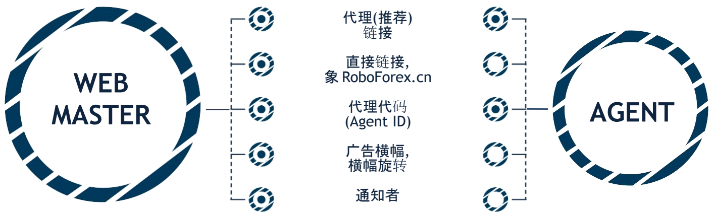
吸引客户到合作伙伴组的方法.

在这些建议中, 我们将谈论我们的合作伙伴吸引新客户到 RoboForex 最有效的方式, 但是首先, 让我们来回答这个问题: 您必须做些什么来确保客户被认为是被您吸引的? Agent 和 Webmaster 有几种方式来吸引客户到他们的账户: